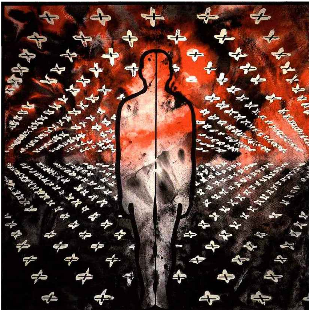
Alfred Tarazi, After the war , 2010, technique mixte sur papier, 50 x 50cm. Sitek