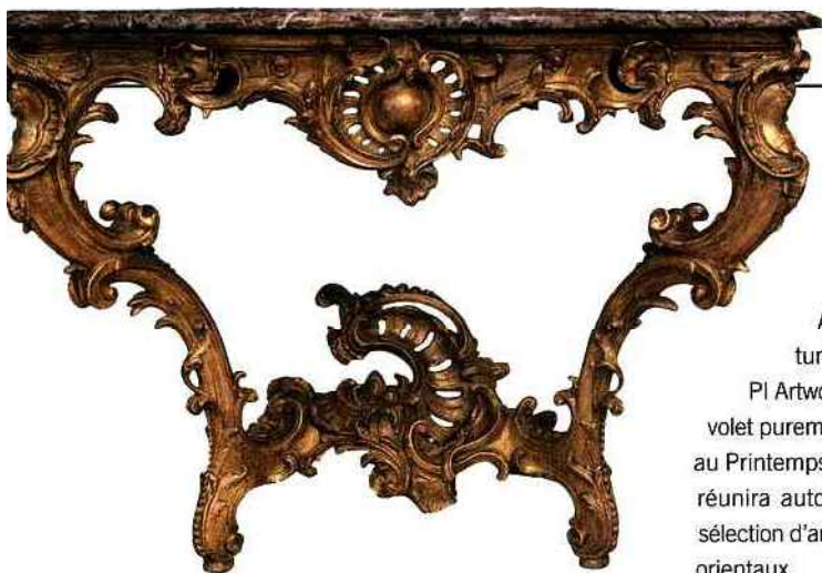
Console à multiples ressauts, époque Louis XV, bois finement sculpté et doré, H : 84 cm, L : 121 cm, prof. : 57 cm (33 x 47 x 22 in), supporte une table de marbre rouge de Rance, dans l'esprit de Nicolas Heurtault, © 2011, Galerie Pellat de Villedon, Paris Fine Art

lumière l'art contemporain et moyen-oriental, et rassemble aux côtés de Dominique Fiat, Gabriel Mitterrand ou Albert Benamou, l'Atelier 21 de Casablanca, Le Violon bleu de Tunis ou Art Space de Dubaï, plus des galeries turques emblématiques, dont CDA Projects et PI Artworks Contemporary center. En contrepoint au volet purement commercial de l'événement, et en écho au Printemps arabe, l'exposition « Images affranchies » réunira autour de l'art vidéo et la photographie une sélection d'artistes contemporains maghrébins et moyen-orientaux.