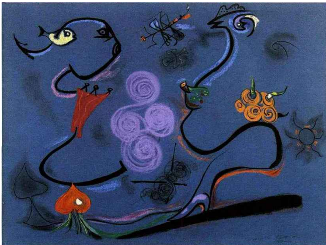
André Masson, Divertissement , pastel sur papier, 1942, 48,3 x 63,5 cm, signé et daté en bas à droite

Consacrée depuis trois ans à « l'avant-garde, l'émergence et la découverte », Cutlog investira la Bourse de commerce, où elle réunira 30 à 40 galeries françaises et internationales. Opportuniste, elle se prolongera du 10 au 12 novembre avec « Cutlog photo », qui aura lieu en marge de Paris photo.