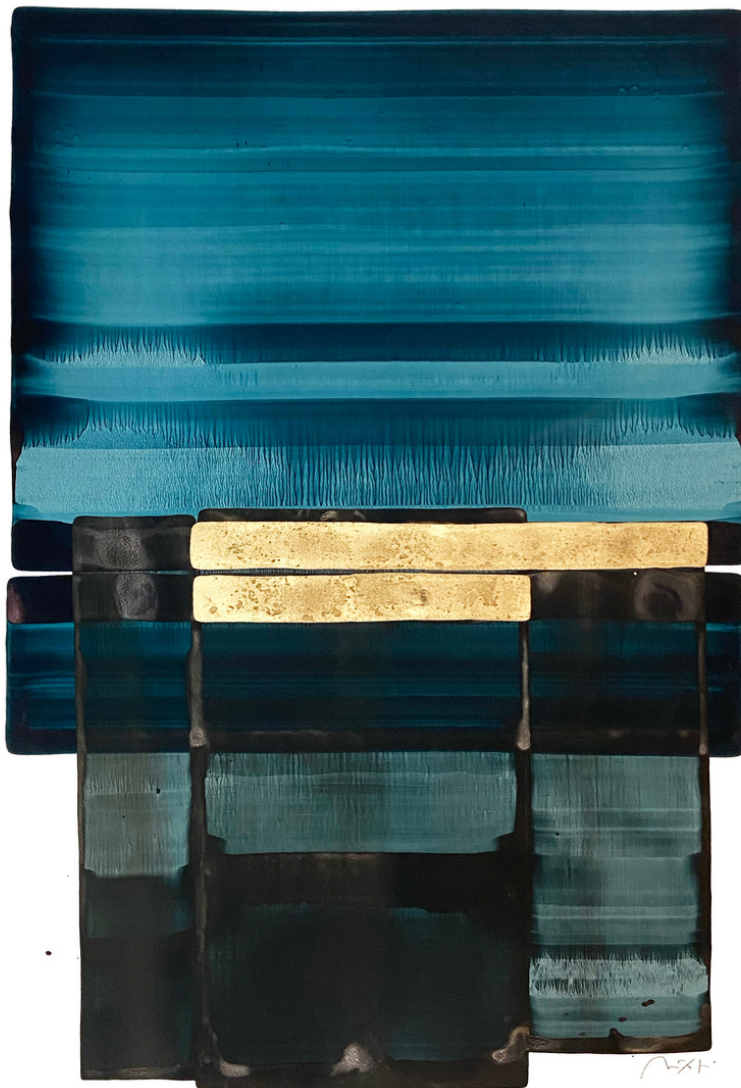
Image : Nicolas Lefevre, Landscape P140, 2022, encre et poudre sur papier, 42 x 80 cm. Image : Nicolas Lefevre, Landscape P139, 2022, encre et poudre sur papier, 100 x 76 cm.