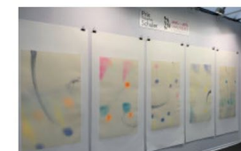
Des invités de marque