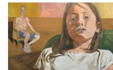
Des coups de cœur