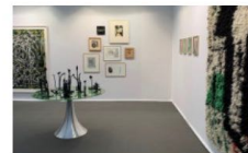
Des propositions originales

En ce qui concerne les premières, notons Hellas (2017), une xylogravure de Damien Deroubaix à la galerie Delphine Courtay (1100 euros), des