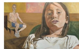
Des coups de cœur