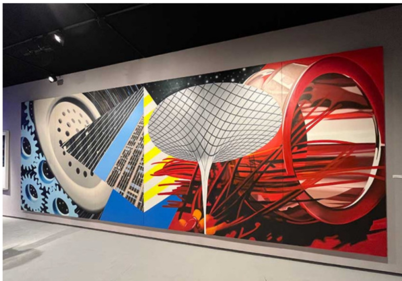
James Rosenquist, détail d' « Eau de robot », 1981-84, huile sur toile, 274,3 x 731,5 cm, Galerie Jean-François Cazeau, Paris.